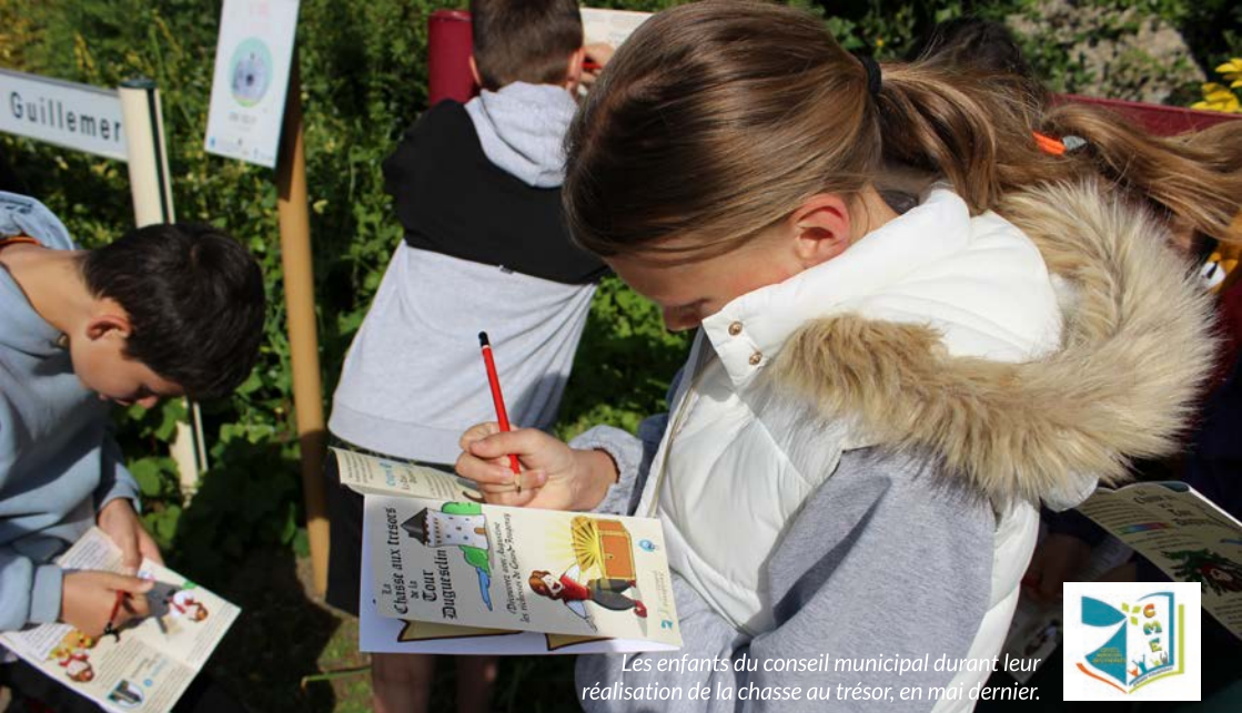
Les enfants du conseil municipal durant leur réalisation de la chasse au trésor, en mai dernier.