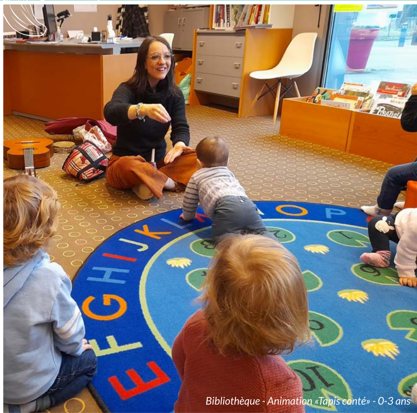
Bibliothèque - Animation «Tapis conté» - 0-3 ans