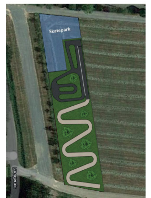
Implantation des trois espaces sur la zone dédiée.

Ces aires de jeux seront implantées au complexe sportif de Langerais. Une réunion publique sur les futures installations a eu lieu le 11 janvier dernier. Le public présent a pu s'exprimer auprès des élus sur les besoins appropriés à prévoir pour ces aménagements sportifs. La Société The EDGE a été retenue pour le « skatepark ». Les travaux devraient intervenir à la fin du 1er semestre 2022 pour une durée de 2,5 mois. Le pumtrack/jumpline sera quant à lui réalisé par la société P-tracks.